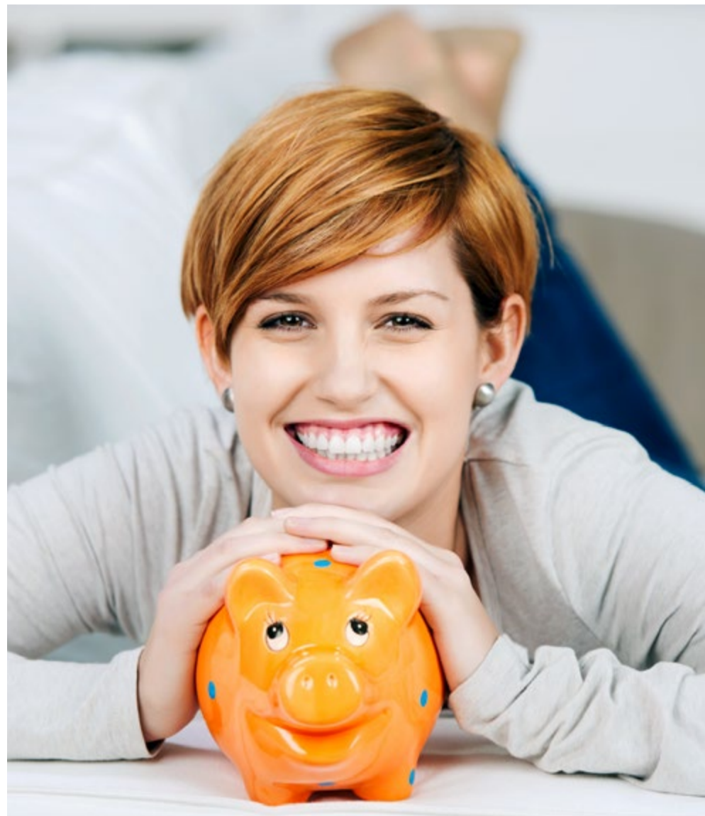
Massgeschneiderte Investition nach Risikoprofil, Anlageziel und Vorsorgeplan.

Ausgangslage für alle Massnahmen bezüglich Ihrer Vorsorgeplanung ist Ihr heutiges Haushaltsbudget! Dieses gibt Ihnen Sicherheit bei allen Besprechungen mit Ihrem Vorsorgeberater. Das Budget wird über die Pensionierung hinaus mit dem jeweils jährlichen Einkommen verglichen, sei es nun Einkommen aus Lohn oder Rente. Erst wenn das Einkommen nachweislich höher ist, als das damit zu deckende Haushaltsbudget, dürfen Sie Anlagen tätigen. Ihr Vorsorgeplaner unterstützt Sie gerne da-