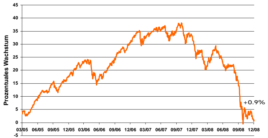
— Gaia-Strategie (50% Obligationenfonds, 50% Aktienfonds)

Die abgebildete Performance der Vergangenheit ist kein Hinweis auf die zukünftig zu erwartende Performance. Es sind keine verbindlichen Renditeversprechen . Es wird keine Rendite garantiert , da eine Fondsanlage nie ein kapitalgarantiertes Produkt darstellt, sondern immer von der Entwicklung der Börse abhängig ist. Wertentwicklung basierend auf den gewichteten NAV's gemäss Strategien. Wiederanlage von Ausschüttungen. Ohne Berücksichtigung von möglichen Ausgabeaufschlägen.